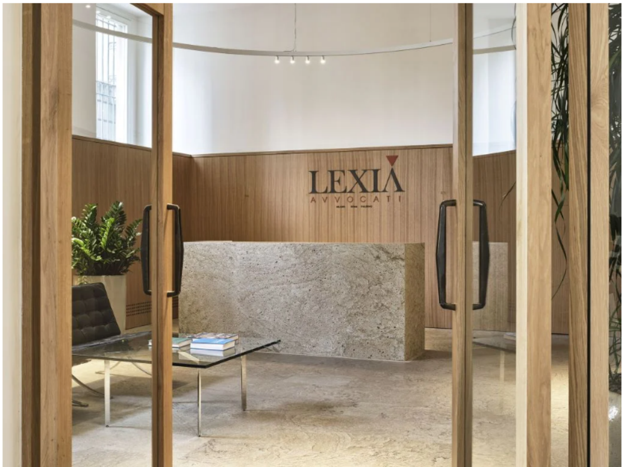
Nuova sede milanese di Lexia